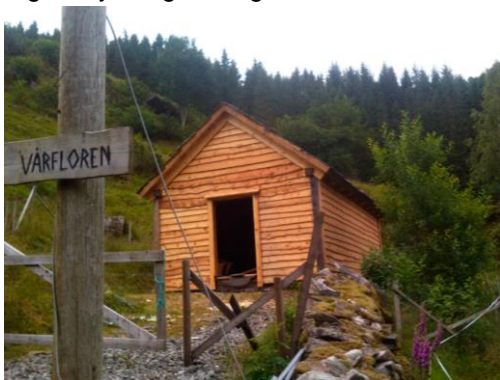
Fig. 3 Restaurering av vårfloer