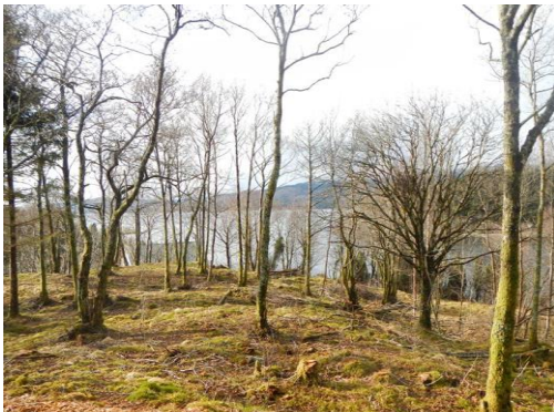
Fig. 1 Rydding av attgrodd kulturmark

Dei tiltaka som dominerer er rydding av attgrodd kulturmark og oppsetjing av gjerde. Det er løyvd midlar til rydding av tilsaman 520 dekar til beite og oppsett av 16,7 km gjerde i våre fire samarbeidskommunar. I tillegg er det løyvd midlar til restaurering av kulturminne, (mellom anna steingjerder og gamle bygningar), fjerning av gamle gjerde og piggråd, samt ålmennytige tiltak som legg til rette for friluftsliv(fig. 1-4).