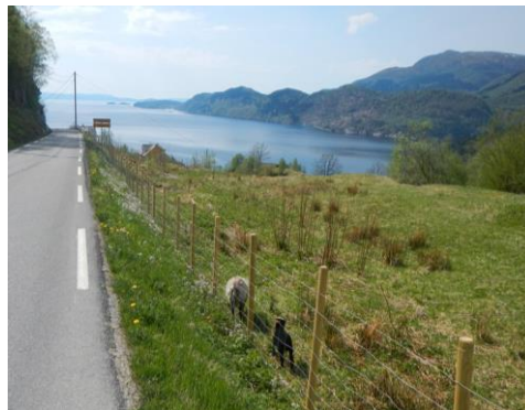
Fig. 2 Oppsett av gjerde